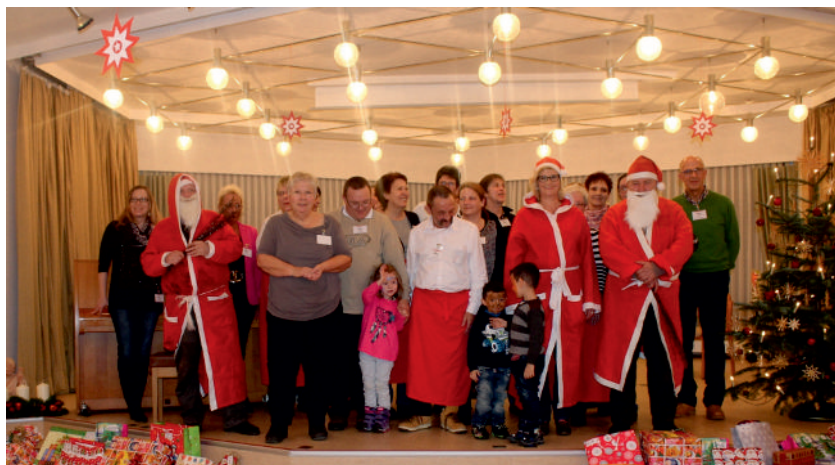
Zille-Team und Helfer 2015

Weihnachtsteam. Ca. 50 Gäste werden an jedem Tag erwartet. Das festliche Menü für die drei Tage ist bereits festgelegt. Alle sind eingeladen – die Geldbörse kann zu Hause bleiben.